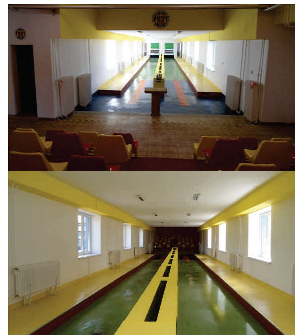
Pohľad na kolkársku dráhu

Pred začiatkom 52. ročníka Festivalu kultúry a športu sa uskutočnilo odovzdanie a prevzatie stavebných objektov : Rekonštrukcia tribúny, Kanalizačná prípojka a Rekonštrukcia kolkárne v rámci projektu Zlepšenie turisticko – rekreačnej infraštruktúry Sanoka a Medzilaboriec . Stavebné práce na objekte tribúny boli zrealizované vo výške 261 397 Eur , na objekte kolkárne vo výške 100 501 Eur a kanalizačná prípojka bola zrealizovaná za 31 253 Eur. Tieto stavebné objekty boli počas festivalu v prevádzke a boli k dispozícii športovcom a návštevníkom festivalu . Dodávateľ stavby v predstihu ukončil stavebné práce na uvedených objektoch ( ukončenie stavby podľa zmluvy o dielo je stanovené na 5.8.2014 ) , čo umožnilo mestu usporiadať festival v tradičnom termíne.